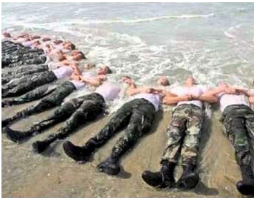
Foto de una sesión de entrenamiento de los Navy Seals estadounidenses. De los 38 Navy Seals que supuestamente mataron a Osama ben Laden, 30 murieron en diversos accidentes en las semanas posteriores a la operación.

Pero el general estadounidense Carter Ham, comandante del AfriCom, siente la sangre hervir en sus venas cuando el Pentágono le ordena coordinar sus acciones con el GICL, vinculado a al-Qaeda. ¿Cómo es posible trabajar en Libia con los mismos individuos contra quienes se está luchando en Irak y que han matado soldados estadounidenses? El Pentágono depone de inmediato al general Carter Ham, en beneficio del almirante James Stavridis, comandante del EuCom y de las fuerzas de la OTAN.