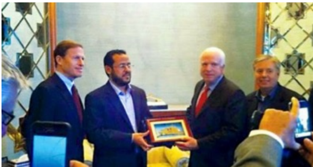
El senador estadounidense John McCain con Abdelhakim Belhadj. En el momento en que los dos hombres se toman esta foto, INTERPOL está buscando a Belhadj como el emir de Daesh en el Magreb.

Ante el fulgurante éxito de Daesh, los islamistas del mundo entero se vuelven hacia este nuevo grupo. Estos elementos, cuya referencia fue al-Qaeda en tiempos de Osama ben Laden y de sus numerosos dobles, adoptan como nuevo ídolo al califa “Ibrahim”. Uno por uno, la mayoría de los grupos yihadistas de todo el mundo juran fidelidad a Daesh. El 23 de febrero de 2015, el fiscal general de Egipto, Hichem Baraket, envía a INTERPOL una nota donde afirma que el gobernador militar de Trípoli, Abdelhakim Belhadj, es el jefe de Daesh para todo el Magreb.