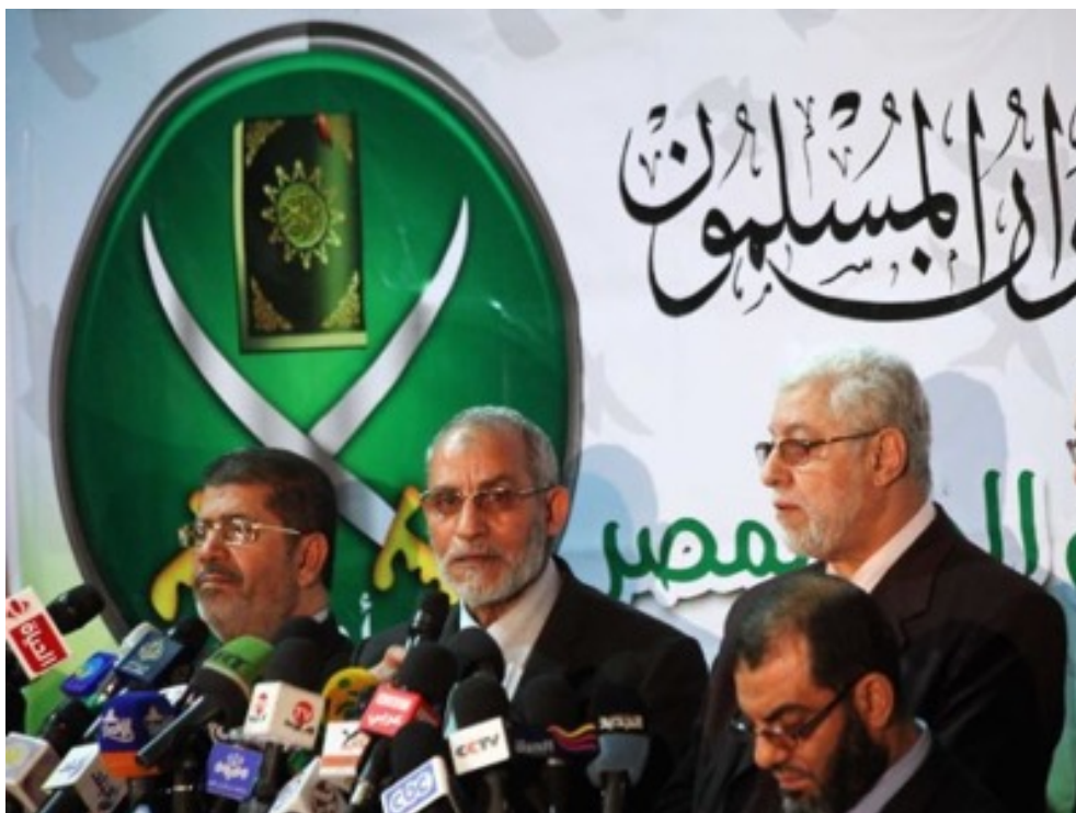
Conferencia de prensa en la sede de la Hermandad Musulmana con el Guía Mundial de la cofradía (al centro) y con el presidente egipcio Mohamed Morsi (a la izquierda).

En definitiva, Mohamed Morsi acaba ganándose la enemistad de todos. Todos los partidos políticos, incluyendo a los propios salafistas –aunque exceptuando, por supuesto, a la Hermandad Musulmana– comienzan a participar en manifestaciones contra Morsi. Esas protestas llegan a reunir 33 millones de personas que salen a las calles y llaman al ejército a devolver el país al pueblo egipcio. Indiferente al clamor del pueblo, el presidente Morsi ordena al ejército egipcio que se prepare para atacar la República Árabe Siria, en ayuda de los seguidores sirios de la Hermandad Musulmana. Esa decisión colmará la copa, sellando su destino como presidente.