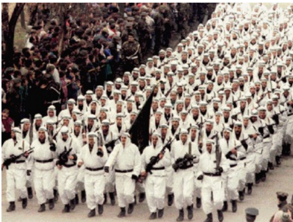
La “Legión Árabe” de Osama ben Laden desfila ante el presidente bosnio Alija Izetbegovic en Bosnia-Herzegovina.

La guerra contra Argelia acaba por extenderse a Francia. Jacques Chirac y su ministro del Interior, Charles Pasqua, interrumpen el apoyo de París a la Hermandad Musulmana e incluso prohíben los libros del predicador de la cofradía, Yusef al-Qaradawi. Lo que les interesa es mantener la presencia francesa en el Magreb, mientras que los británicos pretenden erradicarla. En 1994, el Grupo Islámico Armado (GIA) toma como rehenes a los pasajeros del vuelo Argel-París de la compañía Air France; en 1995, hace estallar bombas en el metro y en un tren parisinos y, en 1998, durante la Copa Mundial de Fútbol organizada en Francia, prepara un gigantesco atentado –que incluía estrellar un avión contra una central nuclear, pero que será descubierto. En todos los casos, los sospechosos que logran escapar encuentran refugio en Londonistán.