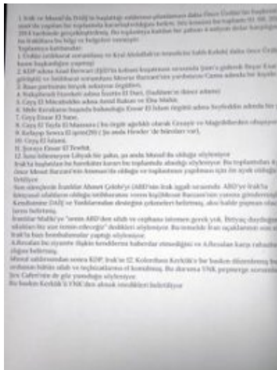
Parte del acta de la reunión presidida por la CIA en Amman, documento redactado por los servicios de inteligencia de Turquía y dado a conocer por el diario kurdo Ozgur Gundem en su edición del 6 de julio de 2014.

Según el acta de la reunión realizada en Amman, combatientes sunnitas van a ser reagrupados bajo la bandera del EIL. Recibirán medios de transporte y grandes cantidades de armamento fabricado en Ucrania. Tomarán el control de una extensa zona –esencialmente desértica– que abarcará territorios pertenecientes a Siria e Irak, y proclamarán allí un Estado independiente. La misión de esos elementos consiste simultáneamente en cortar el eje de comunicación Beirut-Damasco-Bagdad-Teherán y eliminar las fronteras que Francia y Gran Bretaña habían implantado entre Siria e Irak. El ex vicepresidente iraquí Ezzat Ibrahim al-Douri, quien encabeza