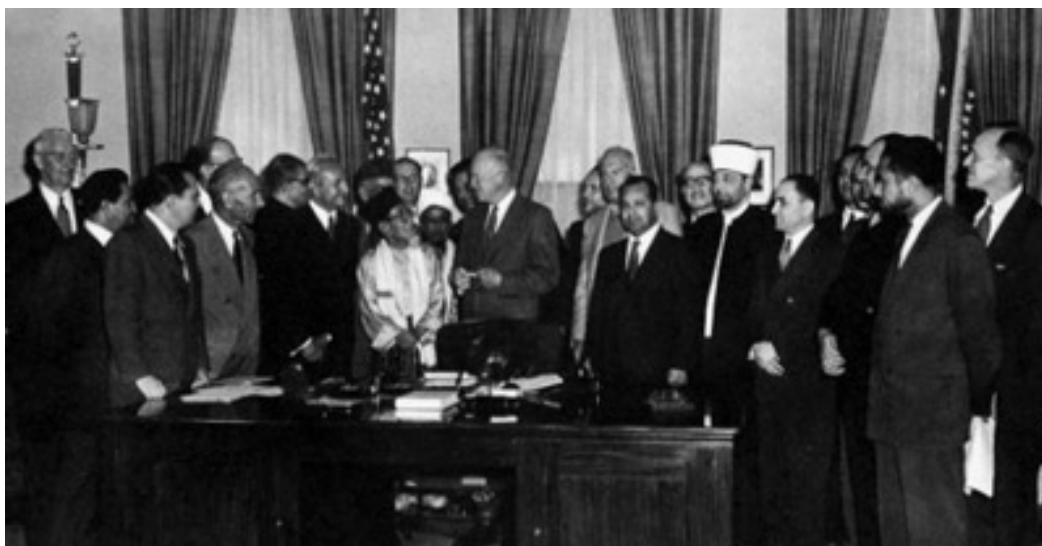
El 23 de septiembre de 1953, el presidente Eisenhower recibe una delegación de la Hermandad Musulmana en la Casa Blanca.

El pensamiento de Qutb es racional, pero no razonable. Despliega una retórica invariable (Alá/Profeta/Corán/Yihad/Martirio), que nunca deja posibilidad de discusión. Plantea la superioridad de su propia lógica por sobre la razón humana.