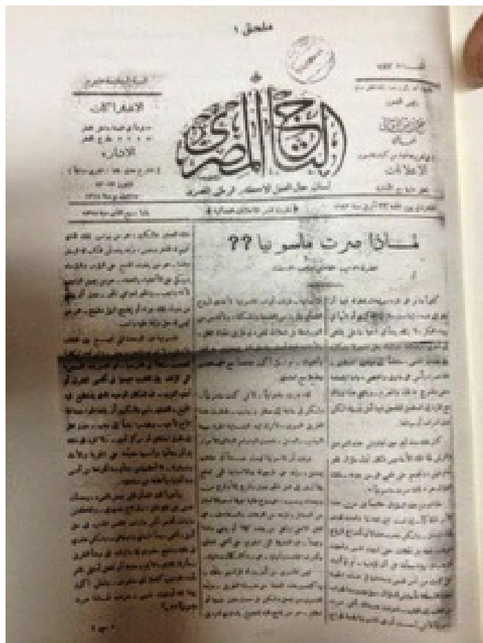
Aunque siempre lo negó, Sayyid Qutb era francmasón. El 23 de abril de 1943, publicó en la revista “al-Taj al-Masri” (“La Corona de Egipto”) un artículo titulado “Por qué me hice francmasón”.